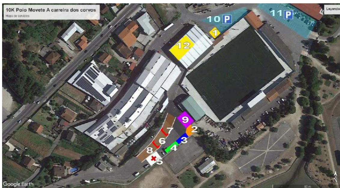
Plano 4: Servicios